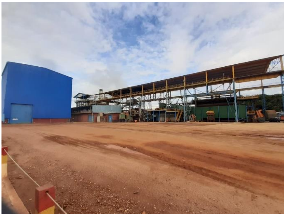
Foto 2. Visão Geral da Usina