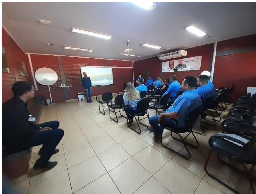
Foto 1. Reunião de abertura

A auditoria in loco se iniciou no dia 18 de dezembro de 2023, com uma reunião de abertura para explanação das atividades a serem executadas, conforme descritas no Plano de Auditoria (Anexo IV) da RUBIATABA INDUSTRIAL S.A. e seus respectivos alinhamentos, caso necessário.