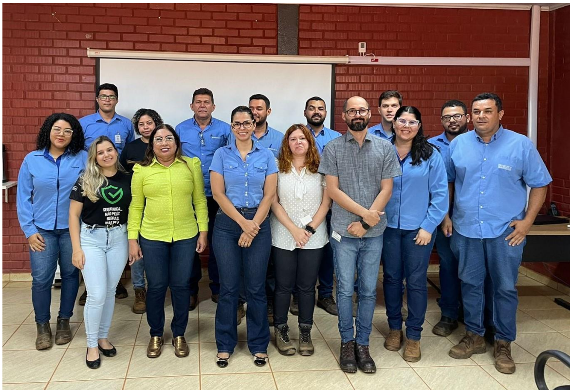
Foto 4. Equipe auditora acompanhada dos representantes da empresa auditada