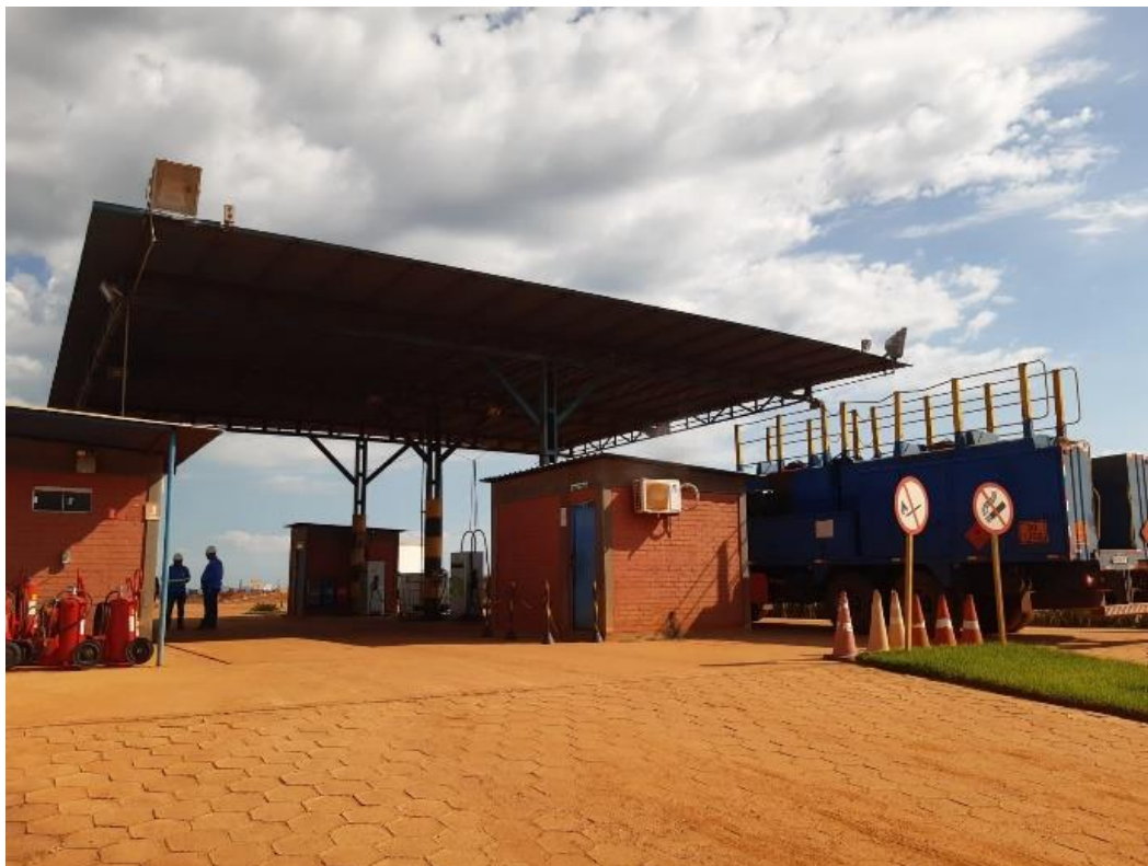
Foto 3. Posto de Combustível